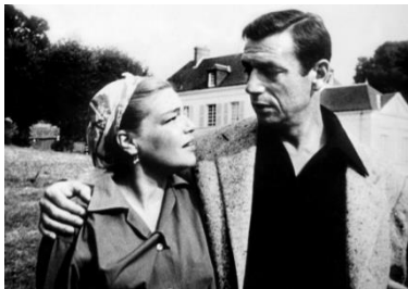
Simone Signoret & Yves Montand devant le « château blanc »

Puis, en septembre, nous nous sommes associés à l'équipe municipale dans l'organisation des week-ends commémoratifs sur les thèmes de la fusion des communes en 1971, et du 100 ème anniversaire des naissances de Simone Signoret et Yves Montand : nous avons pris en charge la buvette et la restauration (voir autre article). A cette occasion, nous avons mis en place une nouvelle offre de restauration avec des assiettes gourmandes (charcuteries – fromages – desserts) qui ont été très appréciées, et que nous ne manquerons pas de vous proposer lors d'autres manifestations.