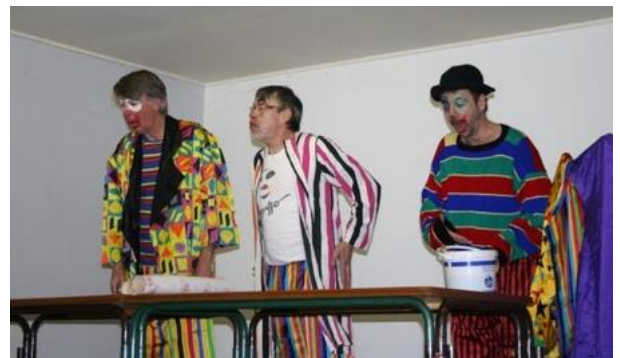
La troupe de clowns Paramos à Authueil-Authouillet en 2016

Au jour de rédaction de cet article, nous sommes concentrés sur la préparation du Noël des enfants qui se tiendra le mardi 14 décembre . A cette occasion, nous recevrons la troupe de clowns « Paramos » et le père Noël pour leur plus grand bonheur. Après tous les retours positifs reçus sur l'organisation mise en place l'année dernière, nous avons décidé, avec la participation de l'équipe enseignante, de la reproduire cette année. Pour mémoire, le principe est d'organiser cette manifestation en semaine, sur un créneau scolaire avec les enfants de l'école.