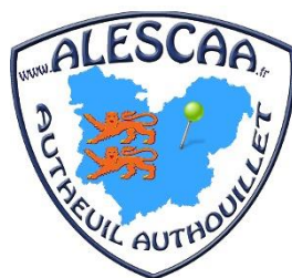
Logo actuel depuis 2018