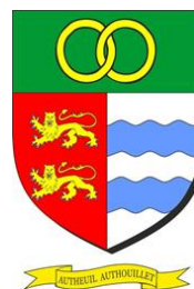
Blason de la commune

C'est pour moi l'occasion de rappeler que l'assemblée générale est ouverte à tous . Elle n'est pas réservée aux seuls membres de l'association. Chacun peut y venir pour mieux nous découvrir, proposer des idées neuves (nouvelles manifestations, des commentaires sur un évènement passé, etc), ou tout simplement rejoindre l'association. Elle sera suivie d'un apéritif offert par l'association, puis par le repas des bénévoles. Nous y aborderons les projets nouveaux à venir sur 2022 . Certains étaient déjà en gestation avant la crise sanitaire, alors que d'autres sont véritablement nouveaux. Il s'agit des évènements suivants : Festival de l'environnement, Fête des voisins et Fête de la musique (voir les dates dans le calendrier qui suit l'article). Dans le même temps, une consultation est en cours pour proposer un spectacle éducatif à l'équipe enseignante. Celui-ci se tiendrait sur le temps scolaire, à destination de tous les élèves, et pourrait aborder, selon les tranches d'âges concernées, des thèmes tels que les différences culturelles et le langage, l'art et les couleurs, les dangers domestiques, la biodiversité, la terre et le système solaire, les inventions, le corps humain ou le devenir de nos déchets.