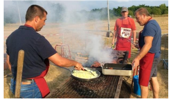
Une partie de l'équipe dans le feu de l'action

Malgré l'aide de la boulangerie « Les délices de la vallée » qui nous a fourni du pain au pied levé (à 21h), nous n'avons pas pu servir tout le monde car il a fini par manquer de frites et saucisses par la suite. Cependant, le service de buvette a pu être assuré jusqu'au bout grâce à « L'Auberge Fleurie » qui nous a dépanné en boissons. Merci à eux pour leur aide.