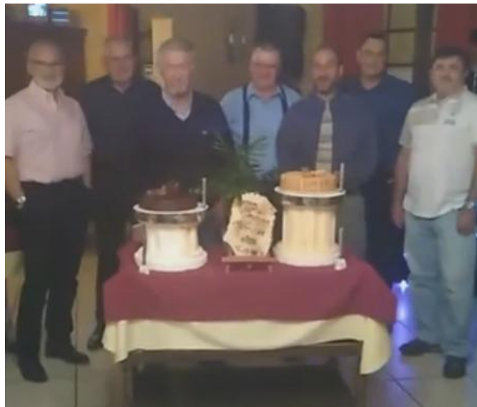
Photo regroupant les présidents de l'ALESCAA lors de la soirée des 40 ans, de gauche à droite :

Pour fêter son 40° anniversaire, l'ALESCAA a invité les bénévoles de l'association depuis le début de son activité ainsi que les cadres des sections encore existantes a passer une soirée à l'auberge des pêcheurs de Port-Mort. Ce fût une belle soirée animée par un duo constitué d'un musicien et d'un imitateur-chanteurs, ou l'ensemble des présents ont pu s'amuser jusqu'au bout de la nuit sans avoir à se soucier des éventuels soucis logistiques et techniques.